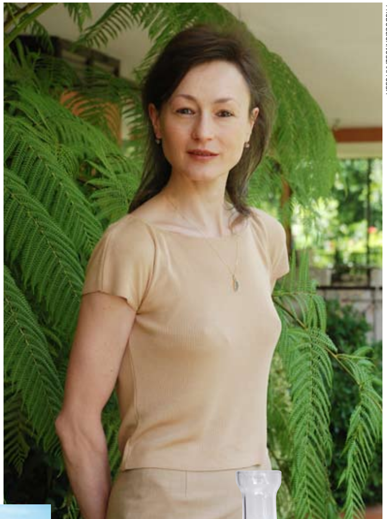
PRODUCCIÓN: JOSEFINA OSSA

que se radicaran acá. Crearon Hessy Röttges Marketing Solutions Ltda. ( www.hyr-marketing.com ) y además de conservar a sus clientes de Europa y América Latina se fueron ampliando al mercado local. Asesoría en internet marketing, desarrollo de sitios webs, diseño de los mismos y programación, son parte de su oferta. ¿Cuál es la impronta de la empresa? Ella enumera: “Sabemos cómo potenciar internet como un verdadero medio de marketing, utilizamos alta tecnología, realizamos diseños sofisticados y exclusivos, y tenemos una red de especialistas que nos permite ofrecer una óptima relación entre soluciones y precios”.